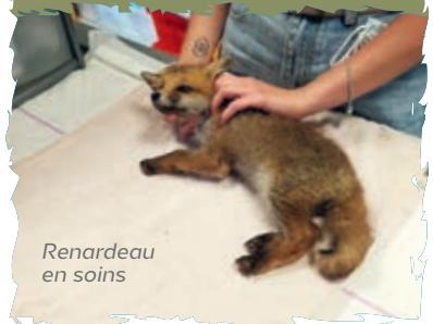
Renardeau en soins

Si vous trouvez un animal blessé, contactez-le directement par mail : crsfs.herault@gmail.com ou par téléphone (seulement le matin) au 04 48 20 43 11 + d'infos : http://herault.lpo.fr/centre-de-sauvegarde