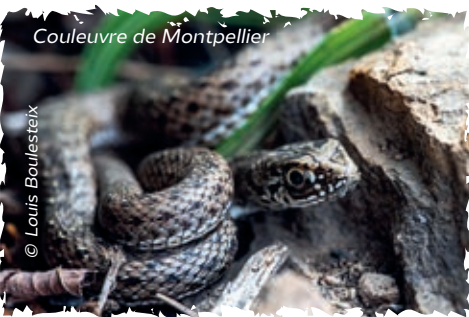
Couleuvre de Montpellier