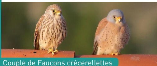
Couple de Faucons crécerellettes